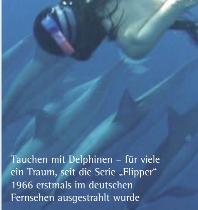
Tauchen mit Delfinen – für viele ein Traum, seit die Serie „Flipper“ 1966 erstmals im deutschen Fernsehen ausgestrahlt wurde

Wenn man sich das Endergebnis dessen, was man sich wünscht in erfüllter Form vorstellen und vor allem fühlen kann, wie es wäre, wenn der Wunsch schon vollkommen erfüllt ist, dann hat man eigentlich das Wesentlichste der Manifestation verstanden. Holografisches Denken heißt, dass sich das Teil im Ganzen widerspiegelt, und auch umgekehrt, das Ganze im Teil. So wandelt sich die äußere Realität gemäß der Innenwelt. Dies ist wohl eins der tiefsten Geheimnisse, das uns zu einem